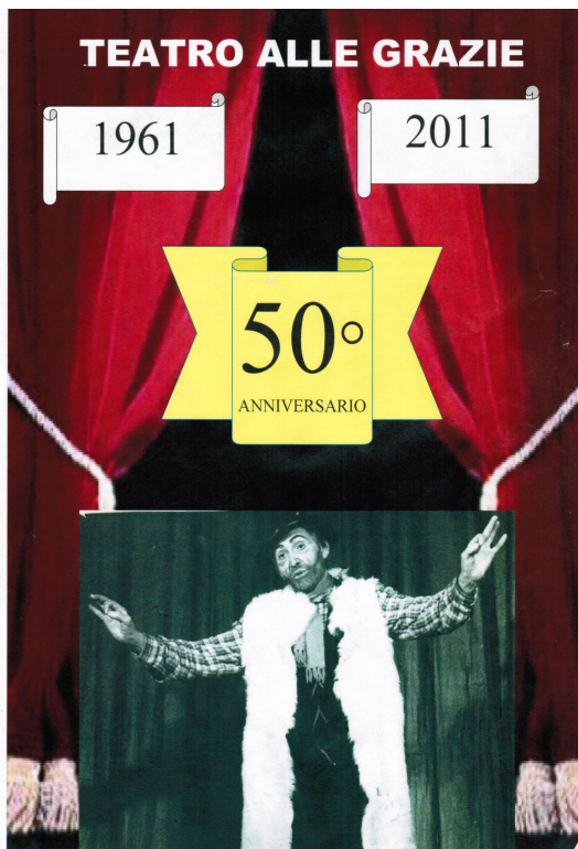
La locandina del 50° del Teatro alle Grazie dove è inserita la foto di Beppe Buzzi " Gelindo "